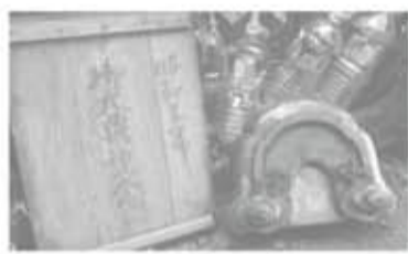
旧中茶屋青年会場の様と御大典記念の木版(明治建築研究会撮影)

昭和は遠くなりにけりて昭和戦前、青年将校たちが活躍した時代を思わせる青年の名称が付けられた懐かしい貴重な旧中茶屋青年会場(元中茶屋会館)の建築は、9月に惜しまれながら解体された。玄関前に建てられていた昭和17年5月建之、寄贈